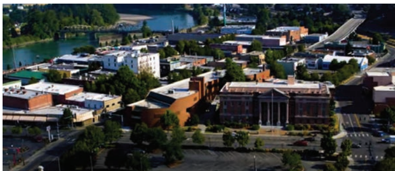
Vista aérea del lugar del proyecto extraída del video de recaudación de fondos