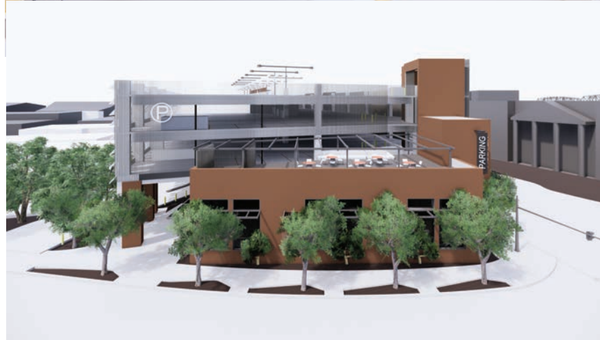
Modelos de masa preliminares sin iluminación y con materiales de referencia por desarrollar