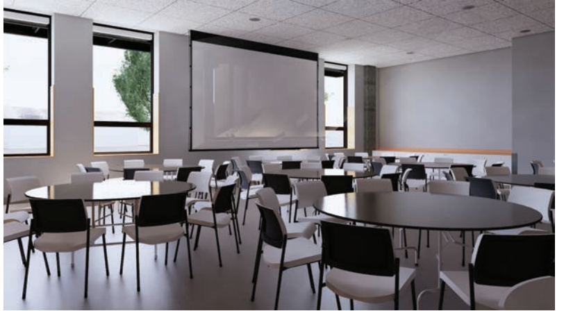
Arriba a la izquierda: Vista del mostrador de salida de la biblioteca con vistas a los espacios de los servicios para jóvenes y adultos y hacia el Centro Comunitario. Arriba a la derecha: Espacio de reunión de la Sala Flex con vistas al Centro Comunitario. Arriba: La Sala Comunitaria, que puede abrirse y ampliarse hacia la Sala Flex para crear un gran espacio de reunión.