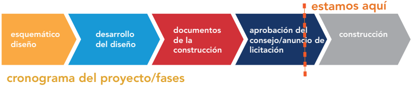
cronograma del proyecto/fases